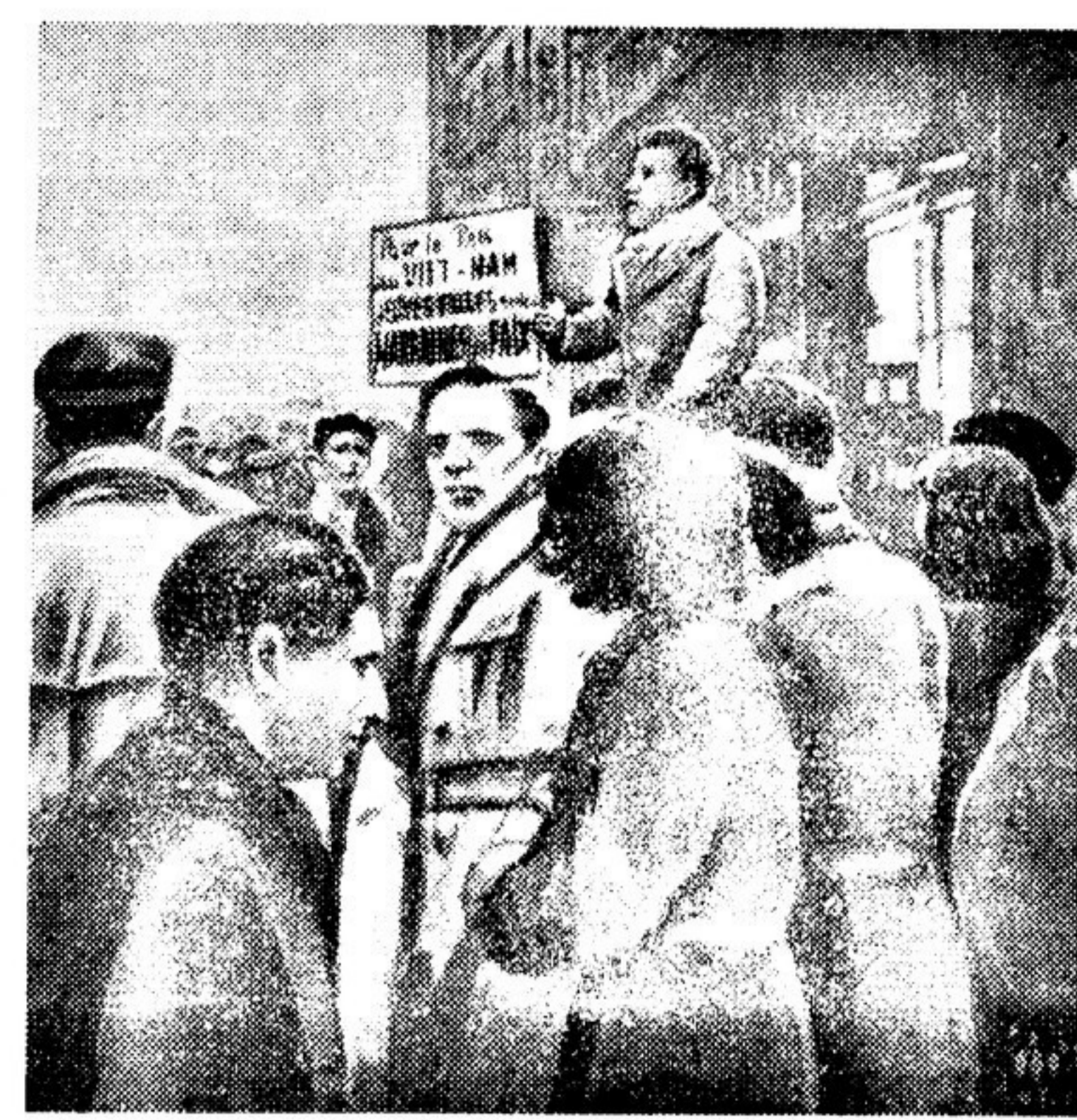
НА СНИМКЕ (слева): парижская молодежь собралась на митинг протеста против агрессивной политики французского империализма. Участники митинга несут плакат «За мир во Вьетнаме!».

Всеобщие выборы в Америке формально проводятся при тайном голосовании. Пропантели Уолл-стрит да хитропы кричат об этом на всех перекрестках. Однако взглядами и намерениями избирателя начинают интересоваться там еще до выборов. В штате Южная Каролина, например, избиратель выдают бюллетень лишь при условии, если он заранее сообщит, за какую партию собирается голосовать. Иначе не дадут бюллетень. В других штатах тайное голосование нарушают тоже заблаговременно — еще в период составления избирательных списков. При регистрации каждый должен заполнить специальную анкету (регистрационный бюллетень) и ответить на вопрос: за какого кандидата будет голосовать избиратель?